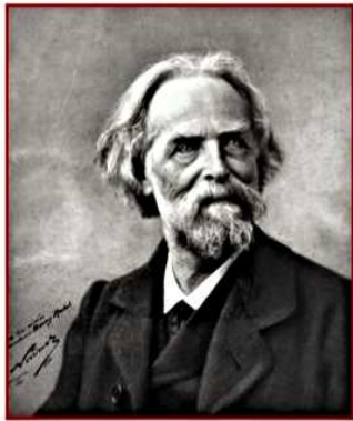
E. Reclus photographié par Nadar

Nous nous promenons sur le ruisseau des Belles Dames en feuilletant des lignes extraites de l'« Histoire d'un Ruisseau » d'Elisée Reclus. (Hetzl, 1869). Né à Sainte Foy la Grande, d'origine périgourdine et girondine, fils d'un pasteur, Elisée Reclus est une personnalité exceptionnelle du monde des sciences et de l'aventure de l'esprit au XIX ème siècle. Inventeur de la géographie moderne, il publia avec son frère Onésime sa monumentale